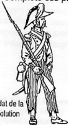
Soldat de la Révolution