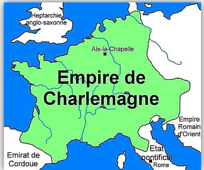
Doc 1 : L'empire de Charlemagne en 814

❻ Doc 3 : Où peut-on voir cette statue ? _____