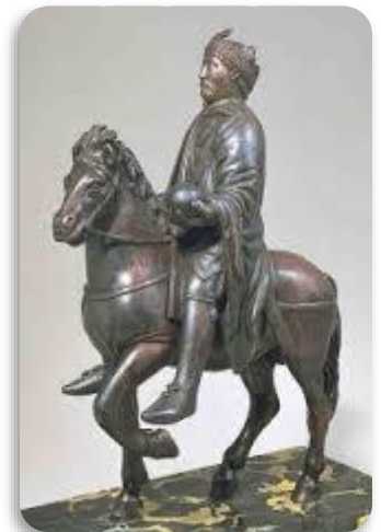
Doc 3 : Statue de Charlemagne, au musée du Louvre.