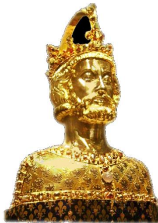
Doc 2 : Le buste de Charlemagne, trésor de la cathédrale d'Aix-la-Chapelle fait après 1349.